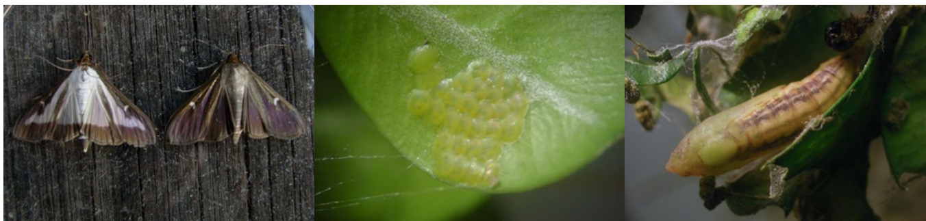
Falter (helle und braune Form), Eigelege auf Blattunterseite, Puppe