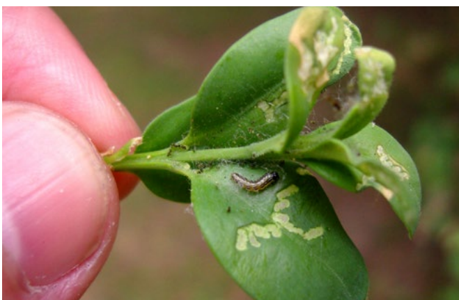
Junge Larve mit Schabefraß Ende Juni

Die gelbgrünen Raupen mit der schwarzen Kopfkapsel schaben als junge Larve an den Blättern und gehen dann in einen Blattfraß über. Die in Gespinsten versteckten Larven verateten sich durch frische grüne Kotkrümel, die auf den Blättern unterhalb der Fraßstelle liegen. Von den Blättern bleiben bei starkem Fraß nur vertrocknete, sichelförmige Reste übrig. Bei extremem Befallsdruck kann auch Rinde angefressen werden, die Raupen bevorzugen es aber abzuwandern, wenn keine Blätter mehr am Buchs vorhanden sind. Daher stirbt auch der Buchs durch den Befall mit Buchsbaumzünslern nicht ab, sondern treibt wieder aus. Seit seinem Auftreten wurden in Deutschland