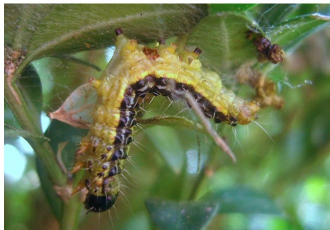
Nach Spritzung durch biologisches Bt abgestorbene Raupe („Schlaf-Sucht“)

Mit dem jährlichen Rückschnitt der Buchsbäume kann im Frühjahr oder im Herbst bereits ein Teil der jungen Raupen