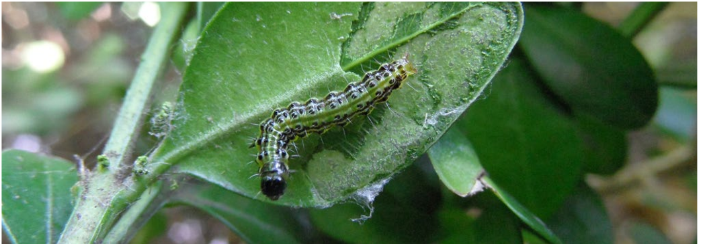
Raupen des Buchsbaumzünslers ( Cydalima perspectalis )